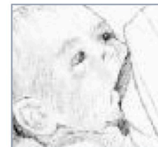
Illustrations by Paul Torgus

Bring baby to the breast with his head slightly tilted back. Baby's chin will press into the breast first. More of your breast will be covered with his lower jaw.